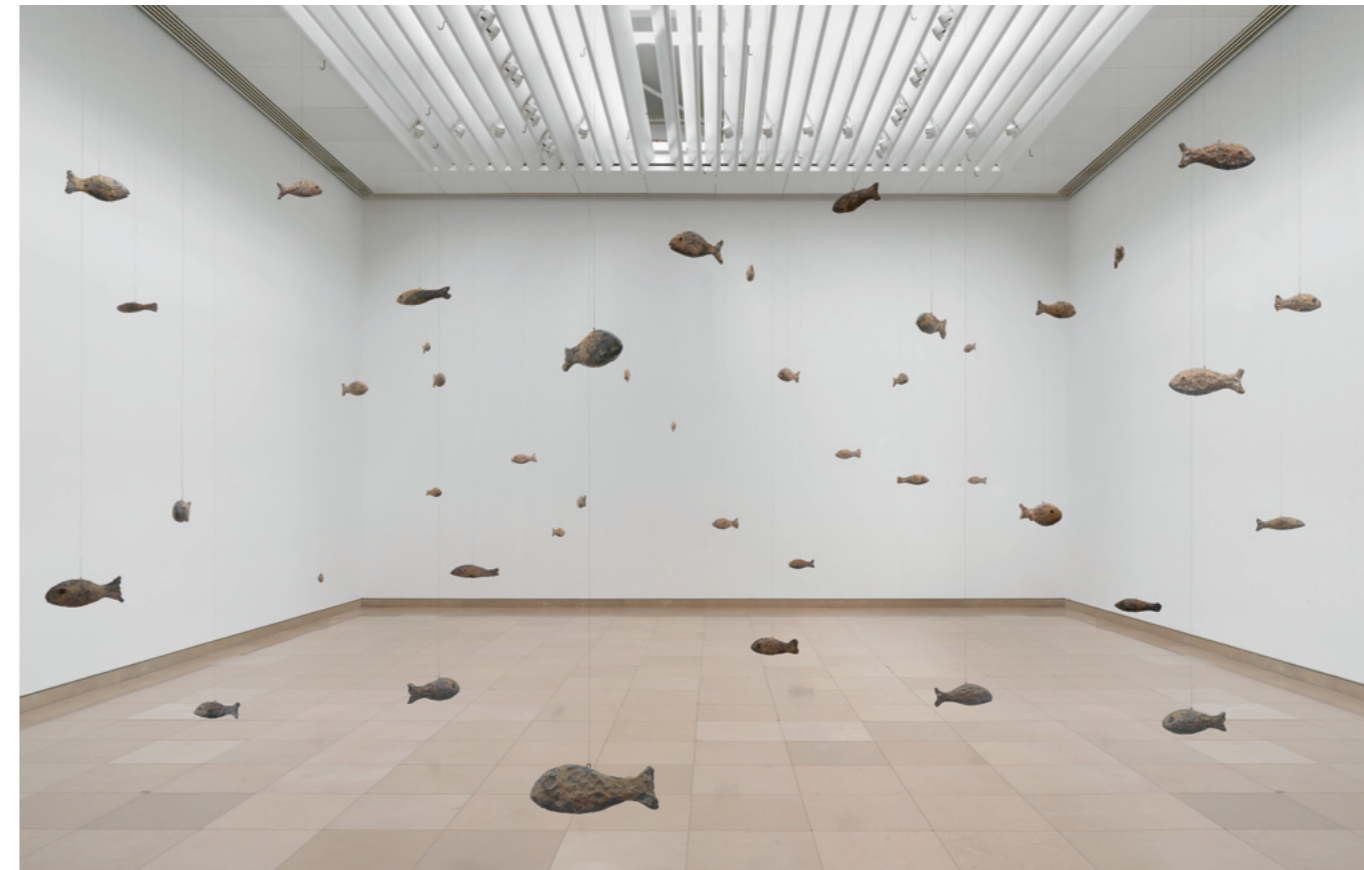
primordial , 2016, 50 Fische aus Bronze Blick in die Ausstellung becoming soil , Carré d'Art, Nîmes , 2016

With his space-consuming sculptures and installations, the winner of the 15th Robert Jacobsen Prize presented by the Stiftung Würth takes us back, sometime literally, to the origins of all Being and enables us a direct visual experience of the temporality of day and night, months and seasons. The artist often contradicts his weighty materials – rocks, clay, bronze – with a naïve aesthetic formalism and a deeply poetic meaning.