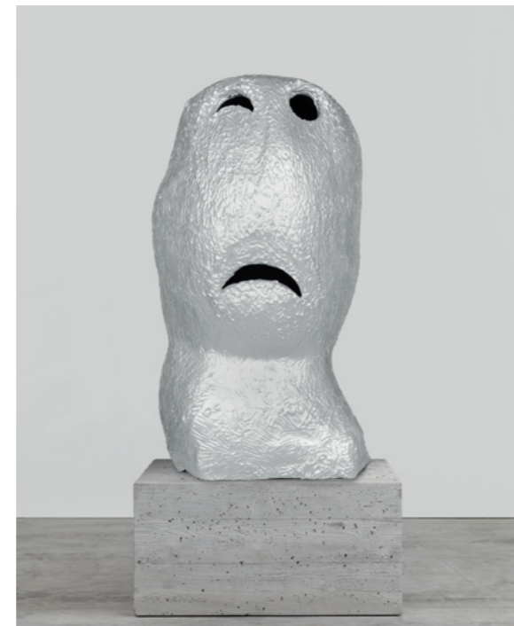
sunrise. east. april, 2005, Aluminiumguss, Betonsockel

Das silbrige Licht des Mondes scheint lediglich im schimmernden Aluminiumguss und der emaillierten Oberfläche eingefangen zu sein. Ugo Rondinones kolossale 8 Meter hohe und über 20 Tonnen schwere stone figure (the loyal) verkörpert indes den ikonischen Charakter seiner bekannten Werkserien, die er bereits auf stark frequentierten Plätzen wie dem Rockefeller Plaza in New York einem größtmöglichen Publikum präsentierte. Das Material des Steins wird vom Künstler als das ursprünglichste betrachtet und schließt auch in Künzelsau auf Materialebene den Kreis der präsentierten Arbeiten. Der gigantische Steinriese, der an einen Megalith erinnert, wurde eigens für die Preisträger-Präsentation angefertigt und bildet sowohl in seiner Kubatur als auch in seiner Aktualität den Höhepunkt der Ausstellung. Für seine „ergreifende Unmittelbarkeit mit einer durch starke Serialität geprägten Formensprache mit unterschiedlichsten künstlerischen