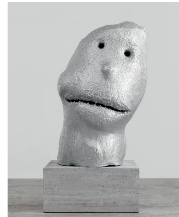
sunrise. east. august, 2005, Aluminiumguss, Betonsockel