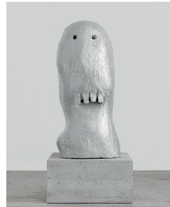
sunrise. east. june, 2005, Aluminiumguss, Betonsockel